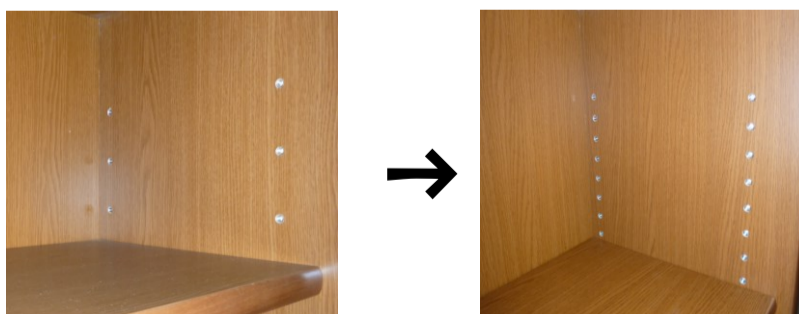
(従来)ダボ穴ピッチ60mm